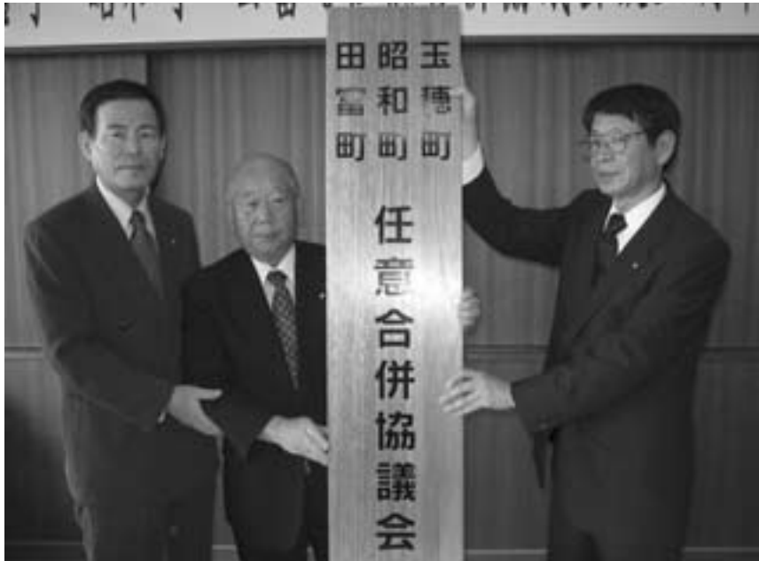
▶協議会の看板かけを行う三町長

8月1日昭和町総合会館において、玉穂町・昭和町・田富町の三町による任意の合併協議会設立調印式が行われました。