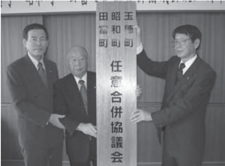
▶協議会の看板かけを行う三町長

8月1日昭和町総合会館において、玉穂町・昭和町・田富町の三町による任意の合併協議会設立調印式が行われました。