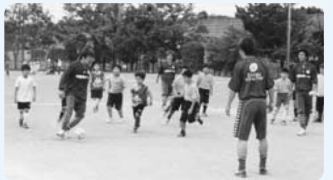
▲ヴァンフォーレ甲府の選手による『ハッピーフットサル』教室の様子

お問合せは、 町教育委員会生涯学習課 生涯スポーツ係 (☎ 275-3737) まで。