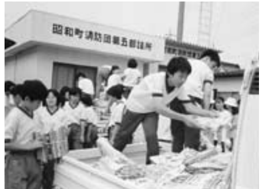
ビールびんはケースがあればケースごと出してください。