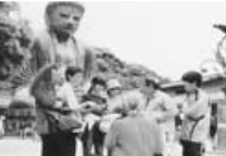
見聞を広め、友情を深めた2泊3日 でした。(5月7日から9日)