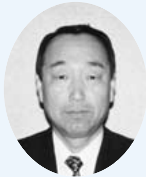
三井 猛 議員