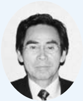
志村 茂 議員