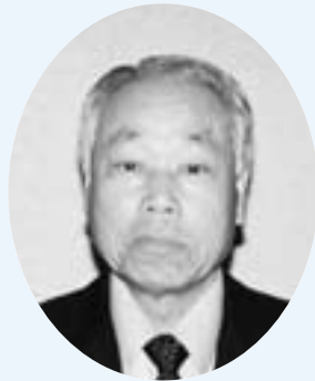
五味 政 議長