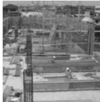
▼柱や壁の鉄筋が立ち上がっています