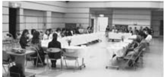
「ふれあいパーティー」の様様

また、現在当相談所に登録されている方を対象に『ふれあいパーティー』を開催します。今年度は春と秋の2回実施する予定です。