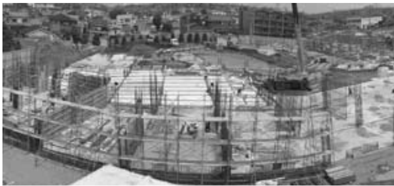
◀校舎部分の基礎ができてきました

建設現場では、前回報告いたしました基礎型枠の設置や生コンの打設を終え、1階の柱や壁の鉄筋の組み立て・型枠の設置へと進んでいます。また、基礎工事や壁・柱の工事と並行して、電気や給排水設備関係の配管工事も行われています。