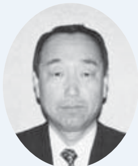
三井 猛 議員