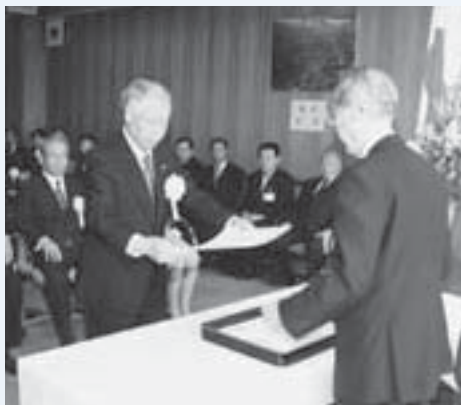
▲ 4月28日の当選付与式

任期満了に伴う昭和町議会議員一般選挙は、4月22日に告示され、定数より2人多い18人が届出をしました。4月27日に投票が行われ、即日開票の結果、16人の新しい町議会議員が決まりました。