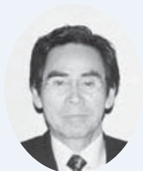
志村 茂 議員