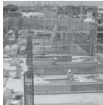
▼柱や壁の鉄筋が立ち上がっています