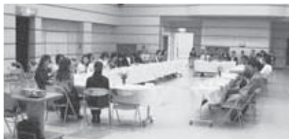
「ふれあいパーティー」の様

また、現在当相談所に登録されている方を対象に『ふれあいパーティー』を開催します。今年度は春と秋の2回実施する予定です。