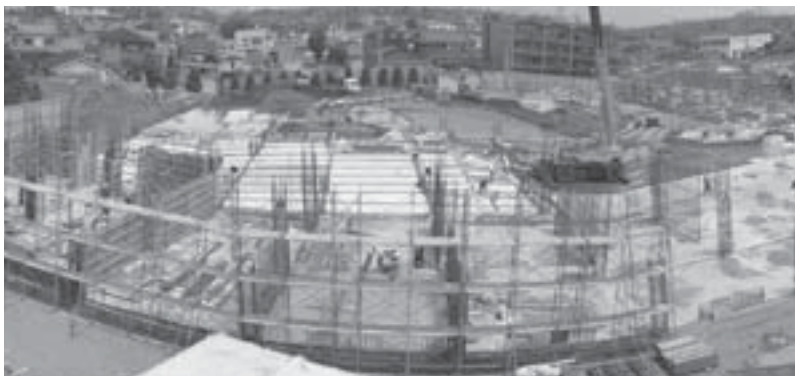
▲校舎部分の基礎ができてきました

建設現場では、前回報告いたしました基礎型枠の設置や生コンの打設を終え、1階の柱や壁の鉄筋の組み立て・型枠の設置へと進んでいきます。また、基礎工事や壁・柱の工事と並行して、電気や給排水設備関係の配管工事も行われています。