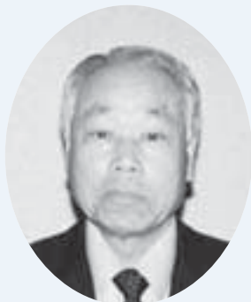
五味 政 議長