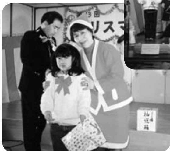
▲サンタクロースからのプレゼントで記念撮影

昨年の12月14日（土）、清水新居公民館において『第13回クリスマスふれあいの夕べ』を開催し、子どもクラブや舞踊部などたくさんの皆さんが参加し、芸能発表やお楽しみタイムなど楽しいひと時を過ごしました。