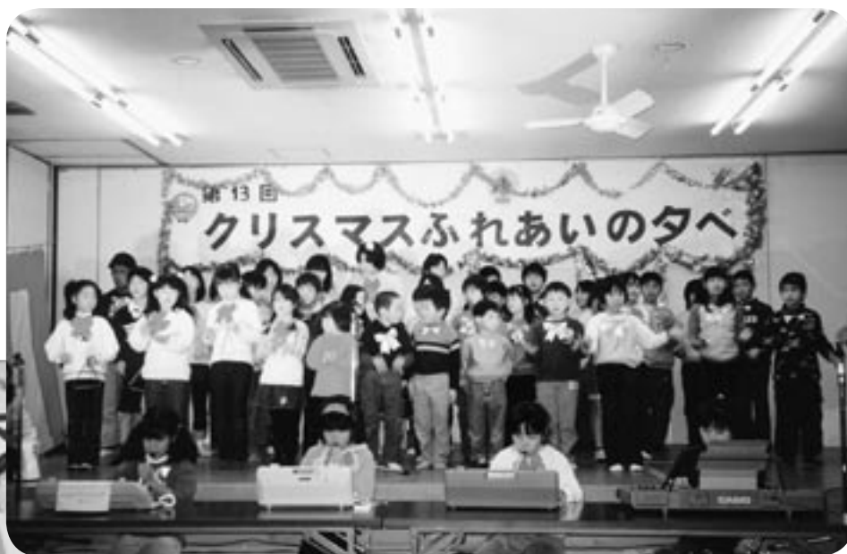
▲「大きな古時計」を歌う子どもたち