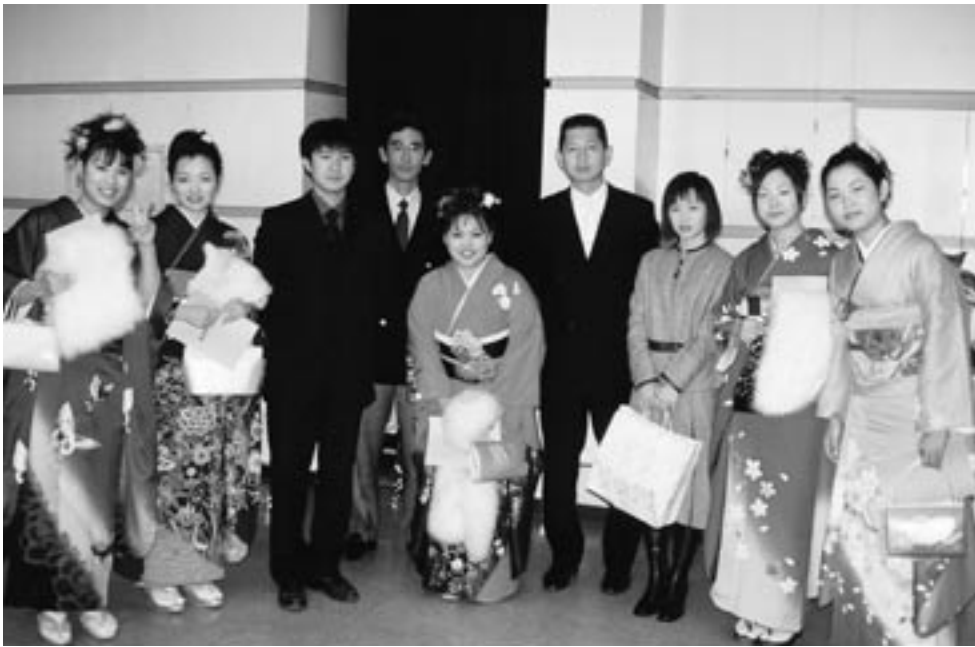
▲久しぶりに再会した恩師といっしょに

1月12日(日)町総合会館で成人式が行われました。今年、町では214人の皆さんが成人となり、式典には122人(男性63人・女性60人)が参加しました。この日は晴天に恵まれ、友人や恩師との久しぶりの再会に思い出話に花が咲きました。