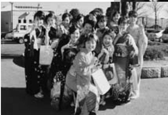
◆久しぶりに再会した友人と いっしょに