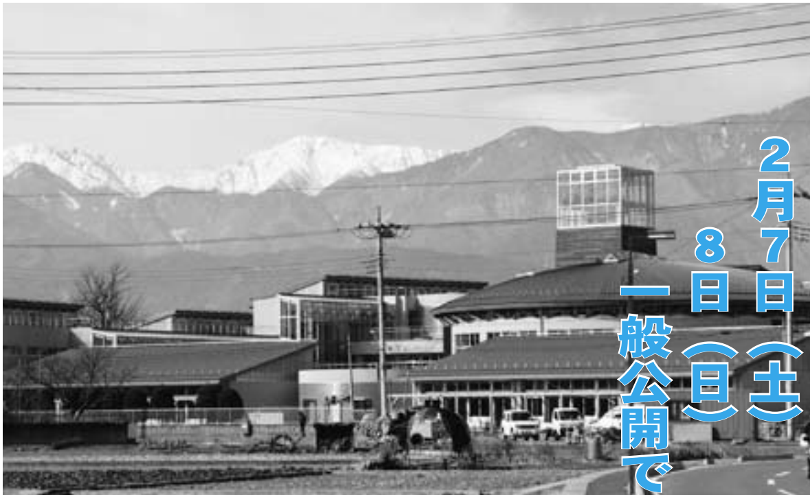
▲ドーム型の体育館と校舎。延べ床面積は校舎が約6,200㎡、体育館は約1,300㎡です。

平成14年11月に建設が始まった押原小学校校舎と体育館が、約1年の工事を終え完成しました。