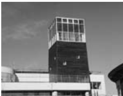
▲ホタルのやぐら：ガラス部分に太陽光パネルが設置されています。

また、雨水を濾過して便器洗浄や散水に利用したり、井戸水を使った冷房パネルも設置されています。1階職員室入口の廊下には工口設備に係るモニタリングが設置され、タッチパネル形式で現在の発電量等を見ることが出来ます。このパネルには工口設備の概要だけでなく、学校内の簡単なお知らせ等も表示できます。