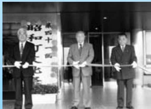
▲第41回文化祭も同時開催されました

各自治会や各種団体・企業による出店、子どもの広場・動物の広場も大勢の人たちで賑わい大盛況でした。