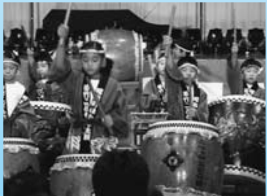
▶ 力強いホタル太鼓