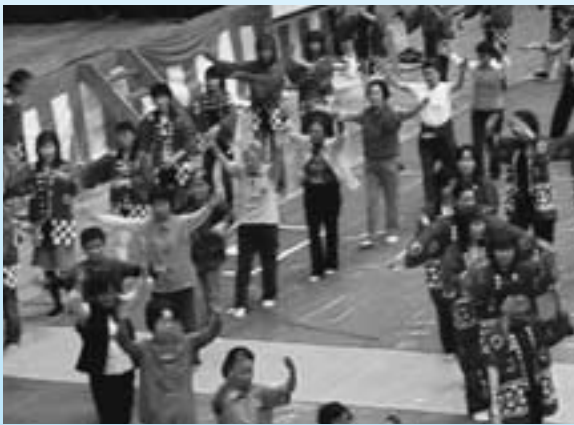
▲大勢の参加で恒例の新昭和音頭を踊りました