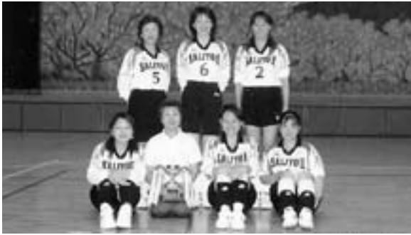
▲優勝した西条二区チーム