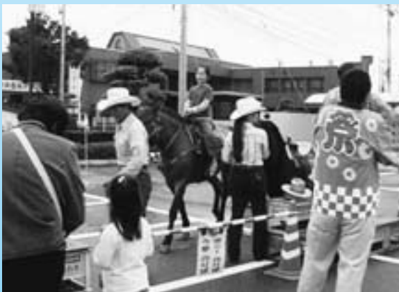
▲子どもの広場・動物の広場は子どもたちに大人気！