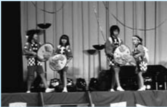
▶ 伝統の郷土芸能笠おどり

また、『第17回ふるさとふれあい祭り』開催のために、多大なご協力をいただきました関係者のみなさまには、心から感謝申し上げます。