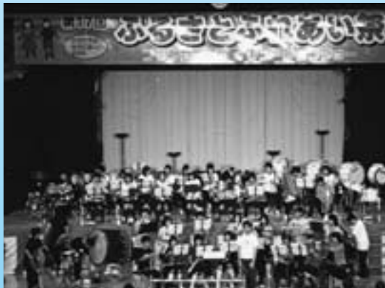
▶ 押原中学校生徒による吹奏楽の素晴らしい演奏に、みなさん聞き入っていました。