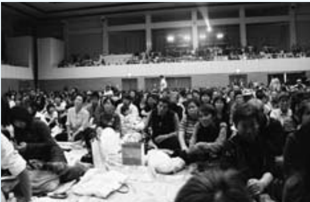
▲会場の総合体育館は1階2階ともに満席でした