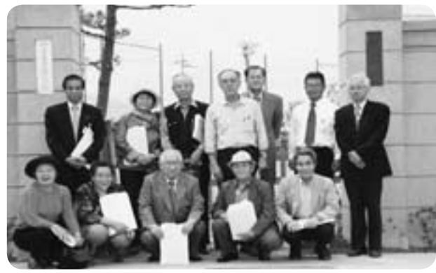
在京昭和会のみなさん