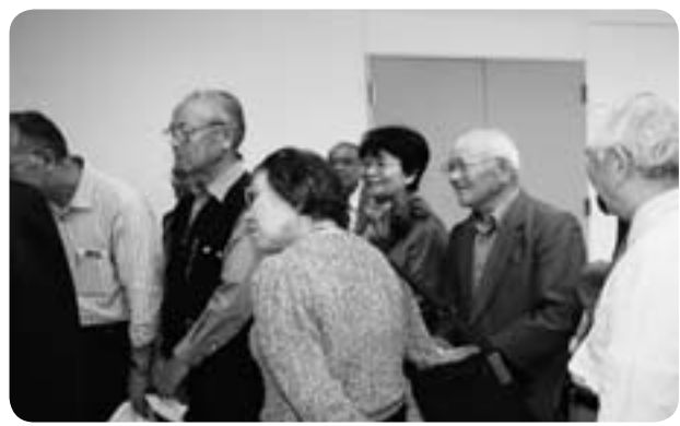
給食センターの見学