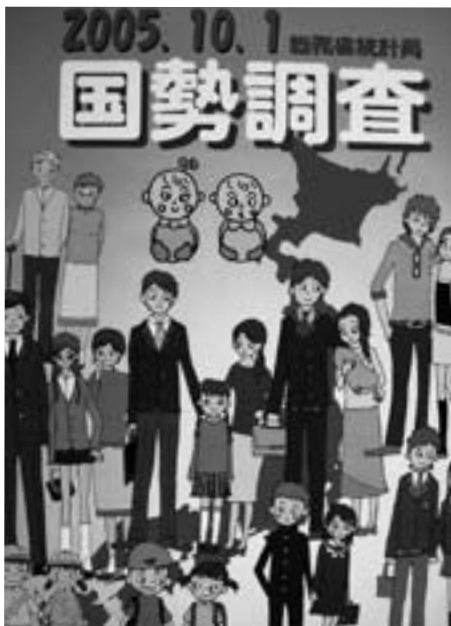
平成 17 年国勢調査佳作ポスター