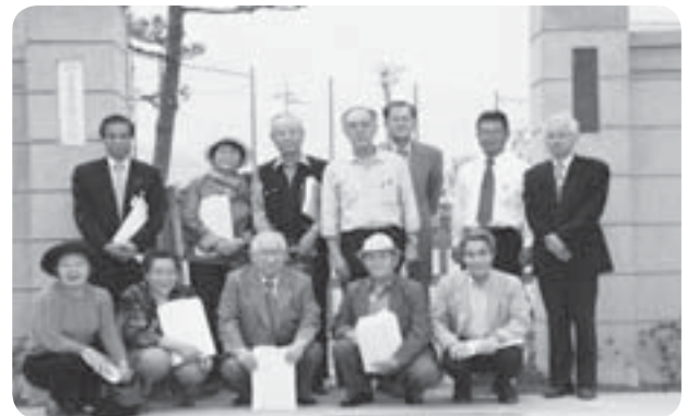
在京昭和会のみなさん