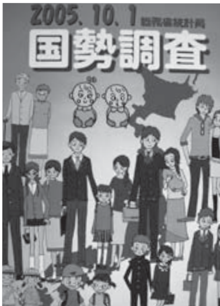
平成 17 年国勢調査佳作ポスター