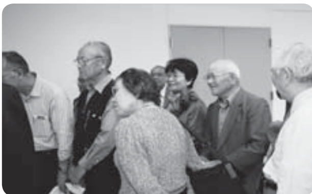
給食センターの見学