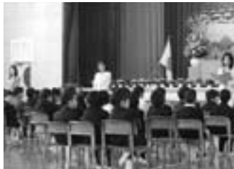
担任の先生の呼名に元気よく返事をする新入生

新入生は、「遊具でたくさん遊びたい」「給食が楽しみ」「サッカー選手になりたい」「など」と学校生活に希望を持って目を輝かせていました。