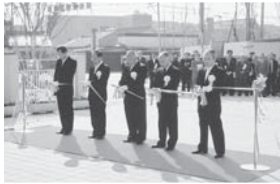
▲ 関係者によるテープカットの様子

公園の公共施設はいつも清潔で美しく、誰もが気軽にこれるような環境でなければなりません。ルールとマナーを守り、みんなで快適に使いましょう。