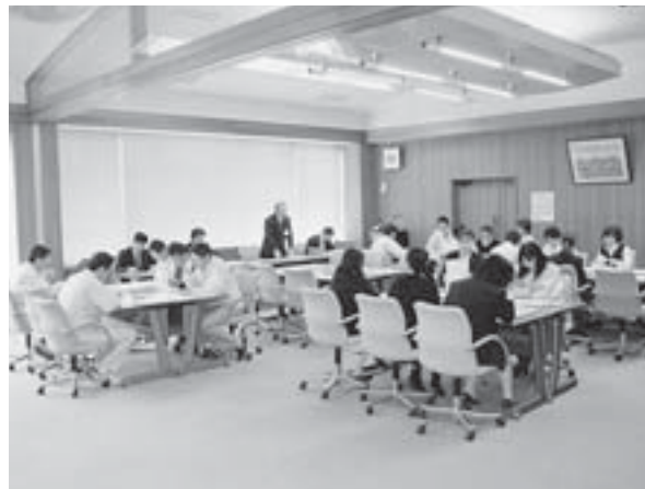
▲行革検討委員会風景（全係長で構成）