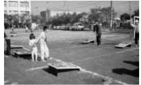
バッグコーナー そのまままで届けっ！