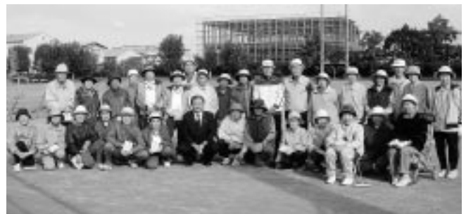
▲ 83歳以上で元気に競技に参加された方々