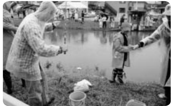
たくさん釣れたかな？