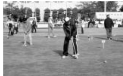
ゲートボール教室 打つときの姿勢も大事だよ！！