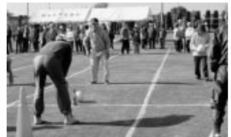
ふれあいコースコーナー ボールよっ、そのまま真っ直ぐ当たって！！