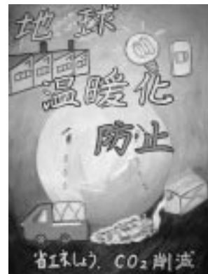
ポスターの部最優秀作品