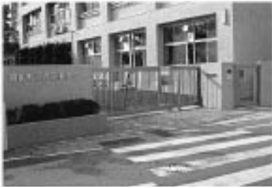
新しくなった押原中学校正門

8月から引き続き行われている西条小学校大規模改造工事については、現在南校舎の普通教室、正面玄関等の改修及び保健室の部分増築を行っています。進捗率は約