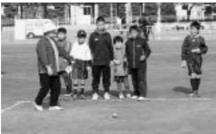
ベタンク教室コーナー ピュット(的)目がけてガンバレ！