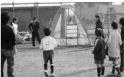
ストラックアウトコーナー 1枚でも多く当たったかな？