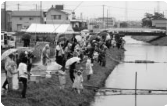
雨でも大勢の方が参加！！