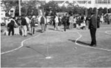
マレットゴルフコーナー 障害物はうまく抜けました！

11月4日(日)2007スポーツフェスティバルが開催されました。参加者のみなさんは、秋晴れの中、スポーツで汗を流し、楽しんでいました。このフェスティバルでは、町愛育会・食生活改善推進員の方々が、温かい豚汁サービスを行って下さいました。各種目の様子や結果は次のとおりです。