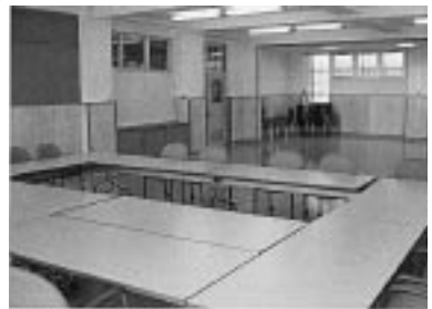
西条小学校会議室の様子