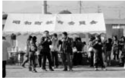
豚汁コーナー いつも大盛況！！とてもおいしかったです