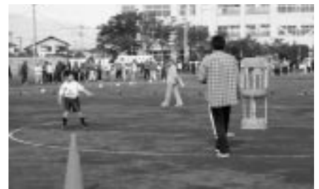
フライングディスクコーナー これでフィニッシュだ～