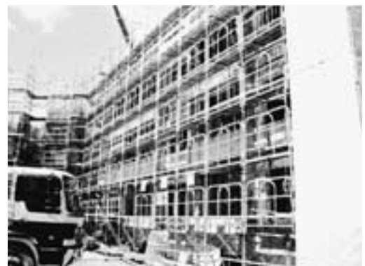
第 1 期工事中の町営住宅

今後は、さらに精査を進め、計画変更のリスクを勘案したうえで、結論を出していく予定です。規模を縮小した場合には、将来、ストック計画をもう一度見直し、住宅を増設するか否かを判断します。