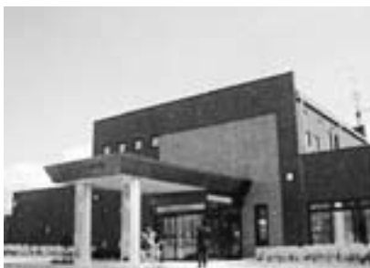
押原公園管理棟(H18年度建設済み)

については、この広報と同時に、現在(見直し前)の公園計画の詳細を整理したパンフレットを全戸配布して、パブリックコメント(町民意見提出制度)を実施します。役場・総合会館・公民館・図書館等に意見箱の設置をいたします。また、メールやFAX、手紙での意見提出も結構ですので、みなさんの声をお寄せください。