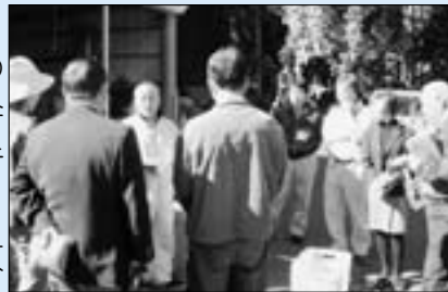
資源循環プロジェクト峡南(身延町)視察