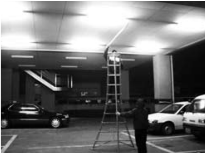
役場会議室下駐車場に6基設置しました。感想をお寄せください。（設置は3月末日まで）

この防犯灯は、イギリス北部の都市グラスゴー中心部で青色の街灯によって犯罪が減少していた事がわかり、日本でも奈良県警察本部を最初に、広島県、沖縄県、静岡県などでも使用されるようになっていきます。