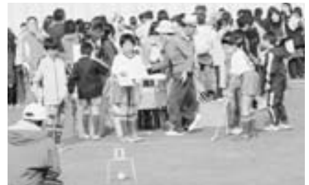
ゲートボール教室 1番ゲート通過！