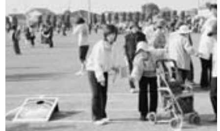
バッグコーナー 的まで届けっ！