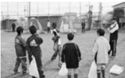
ストラックアウトコーナー 1枚でも多く当たったかな？