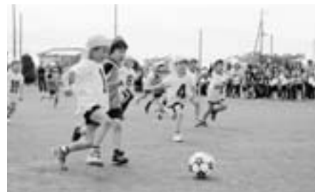
チャイルドサッカー 負けないぞ～