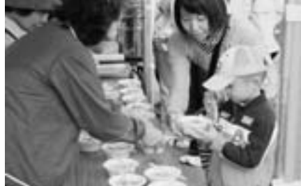
豚汁コーナー あったか。ほっと一息