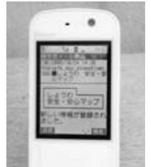
▲携帯電話へメール配信

9月から始めた「安全・安心マップ」。昨年実施した地域情報化に関する町民アンケート調査で要望が多かった内容について情報配信を行っています。11月末現在で不審者情報3件、道路工事情報9件が配信されています。 都市化の進む本町は、山梨県内でも刑法犯等の発生率が高い町です。また、区画整理事業や道路整備等による道路の通行止めについても、町民の皆さまにご不便をおかけしています。これらの情報をできるだけ町民に提供し、安全で安心して暮らせるまちづくりをすすめていくことを目的としています。自分たちの住む地域は自分たちが守るといふ「地域防災力」の向上のため、より多くの方のご利用をお願いいたします。