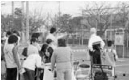
スポーツ吹き矢コーナー