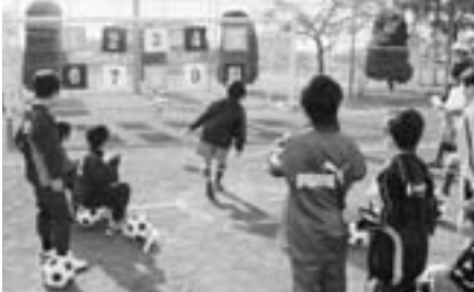
ターゲットシューター めざせ！Jリーガー

11月2日(日)「2008 スポーツフェスティバル」が開催されました。参加者のみなさんは、秋晴れの中、スポーツで汗を流し、楽しんでいました。このフェスティバルでは、食生活改善推進員の方々が、温かい豚汁サービスを行っていただきました。各種目の様子や結果は次のとおりです。