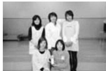
▲昭和町保育所連合会幹事園である第二上河東保育園の保育士さんも利用しています

「保育園でも不審者情報などの防犯情報を知ることは大切です。携帯電話のメールで確認できるので便利です」