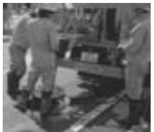
▲マンホール清掃の様子

※下水道に流してはいけない物質等を流すことによって生じるトラブルについては、下水道法によりその原因を生じさせた人に修繕及び清掃等の費用負担をしていただくこともあります。