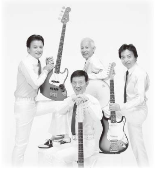
加瀬邦彦&ザ・ワイルドワンズショー