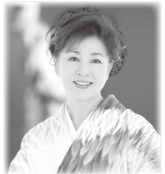
五月みどりショー