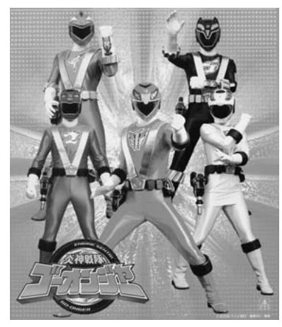
ゴーオンジャーショー