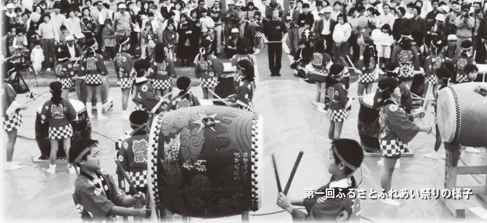
第一回ふるさとふれあい祭りの様子