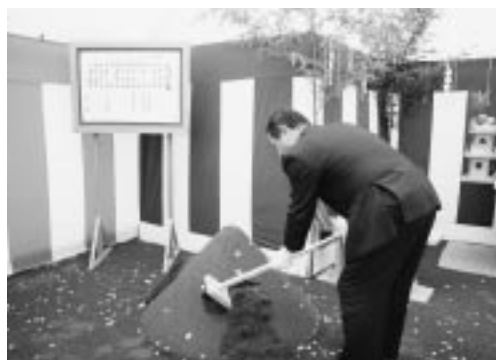
▲町長が鍬入れを行いました

町民体育館は、調査の結果、天井にアスベストが含まれていた事がわかり、老朽化も進んでいる事から安全面を考慮し取り壊しました。跡地には多