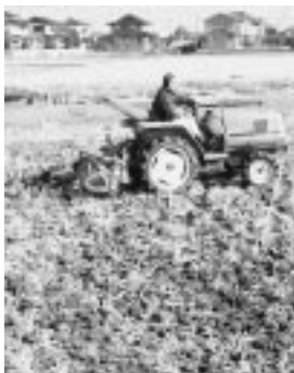
遊休農地の活用に取り組むまちづくり委員会

昨年8月に自主団体として活動をスタートした「まちづくり委員会」は、行政と協働し、環境保全活動などに取り組んでいます。