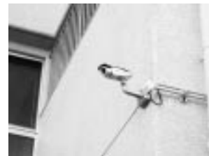
押原中学校に設置した防犯カメラ