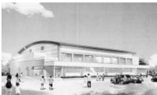
▲地域交流センター完成予想図

目的に使用できる地域交流センターを建設します。建設概要は、鉄筋鉄骨造り、延べ床面積1,640㎡、メインの多目的ホールには、可動式の観客席を設置します。