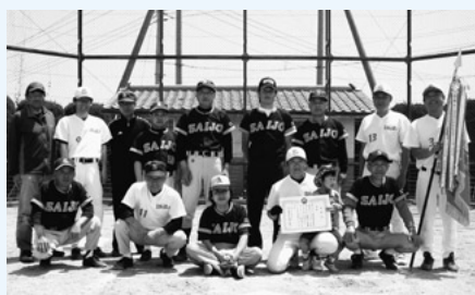
第31回地区対抗 壮年男子ソフトボール大会