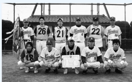
第44回地区対抗 野球大会

5月10日(日)町総合体育館において、平成21年度春の球技大会開会式が行われました。参加者のみなさんは、各種目で汗を流し楽しんでいました。結果は次のとおりです。