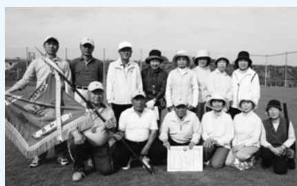
第21回地区対抗 グラウンドゴルフ大会