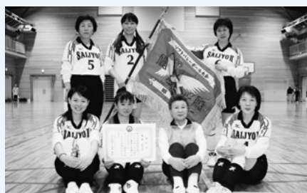
第20回地区対抗 ソフトバレーボール大会