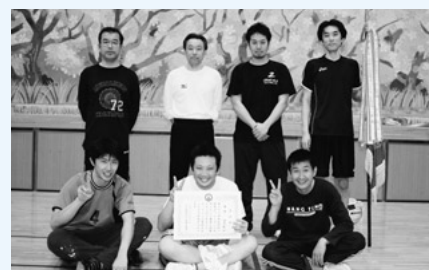
第38回地区対抗 一般男子バレーボール大会