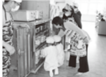
給食は出されたものを食べるだけのお昼ご飯とは違い、自分たちで盛りつけて分け合い食べる楽しみを見つけたようです。

特に、小学校一年生は初めての学校給食を担当の先生のお話をよく聞いて、準備片付けを上手にしています。