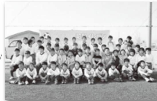
※入団等、問い合わせは生涯学習課へ (275-8641)

昭和町サッカースポーツ少年団です。体験・ 見学はいつでもOKです！みなさん、一緒に ボールを蹴りましょう！