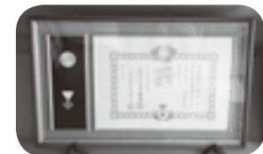
▲勲5等瑞宝章(平成13年受章)