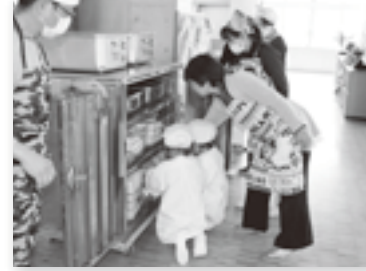
給食は、出されたものを食べるだけのお昼ご飯とは違い、自分でちぎって盛りつけて分けて食べる楽しみを見つけたようです。

特に、小学校一年生は初めての学校給食を担当の先生のお話をよく聞いて、準備片付けを上手にしています。