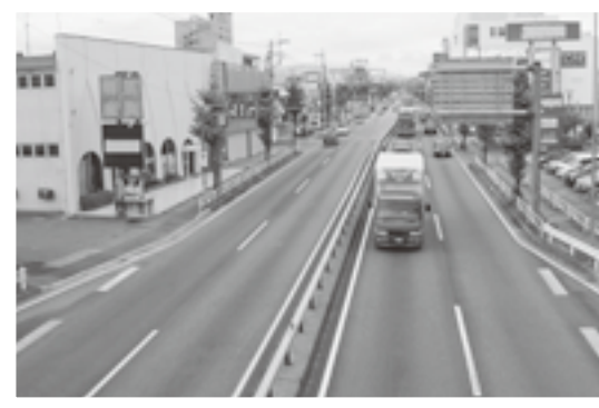
▲現在(平成23年5月)の国道20号(国母交差点付近から西を望む)