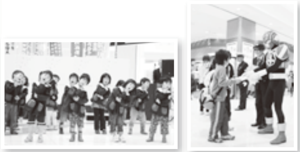
▲ 常永保育園児のお遊戯 ▲ 街頭指導