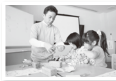
▲▼ ソーラー工作教室