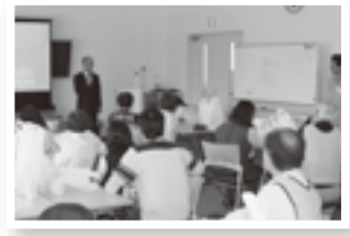
▲ 緑のカーテン教室