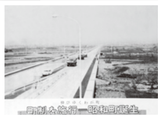
▲昭和46年4月号の表紙(建設中の国道20号)

町制施行時は、人口5,814人世帯数1,394戸の町でした。40周年の今年4月1日の人口は、17,465人