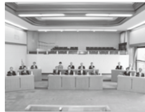
▲選挙後、初の臨時議会が行われました

任期満了に伴う昭和町議会議員一般選挙は、4月24日(日)に投票が行われ、即日開票の結果、16名の新しい町議会議員が選出されました。任期は平成23年4月30日(土)から4年間です。また、当選証書付与式が4月25日(月)の午前10時から役場の会議室で行われ、町選挙管理委員会の相川誠委員長から、当選証書が付与されました。