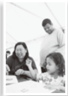
▲ お絵かきマイバッグ