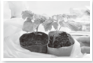
▲ ゴーヤ(ニガウリ)の苗「緑のカーテン」に育ちます