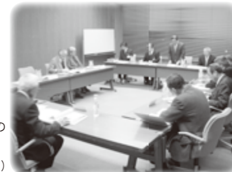
▲ 第3次行財政改革審議会