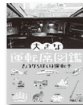
写真 元浦 年康 学研教育出版

電車、バス、飛行機、船、 スペースシャトルなど 10種類の乗り物の運転席が 大きな写真で紹介されてい ます。 運転のしかたも載ってい ます。運転手の気分を楽しめ る1冊です。