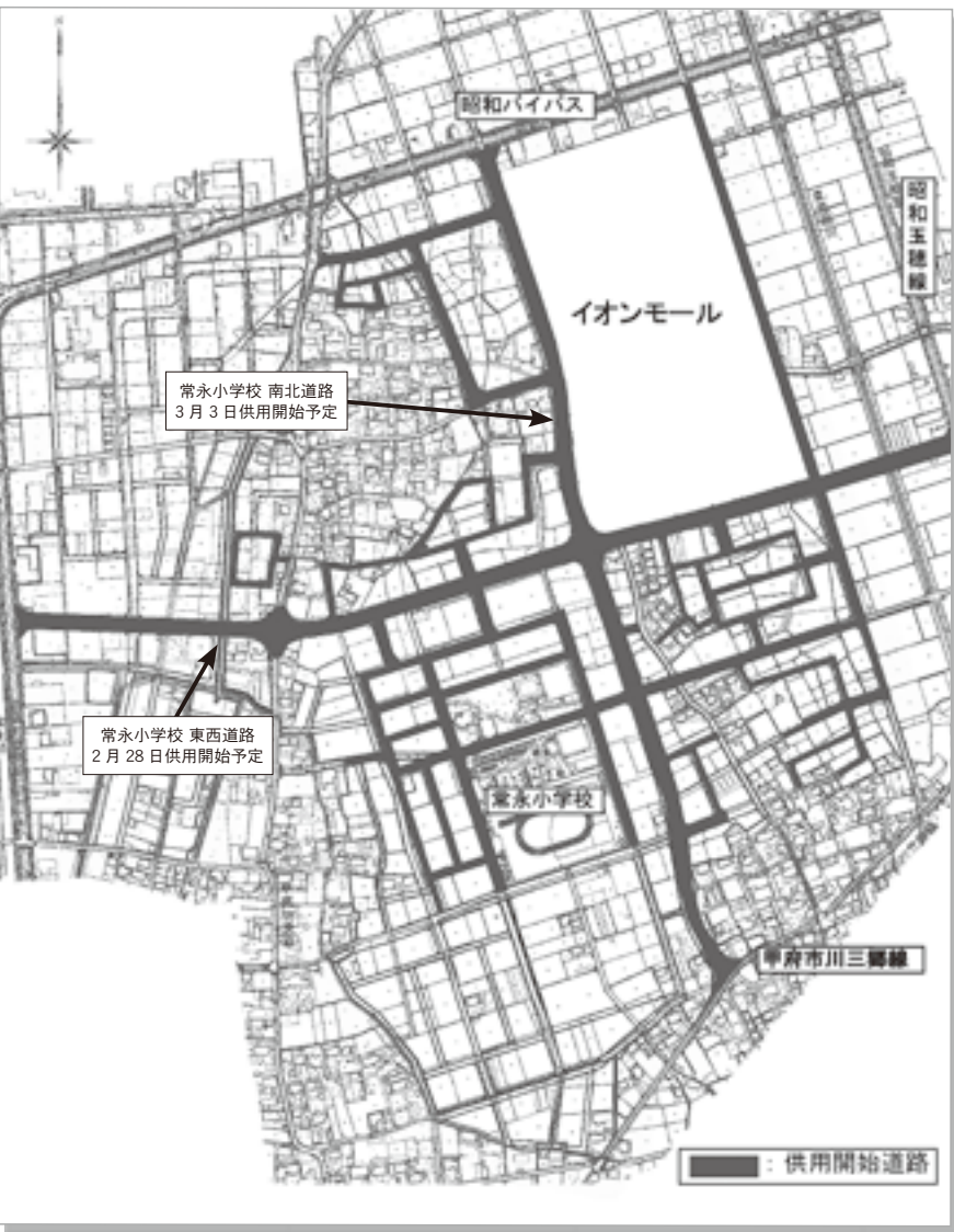
※天候や工事の進捗状況により、供用開始日が前後することがあります。