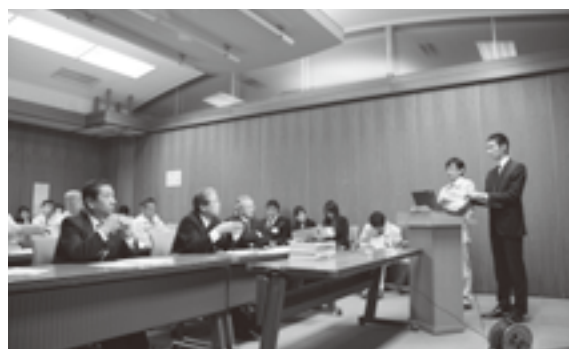
▲若手職員プレゼンテーションの様子

*ラスパイレス指数とは、国家公務員の給与水準を100とした場合の地方公務員の給与水準を示す指数です。