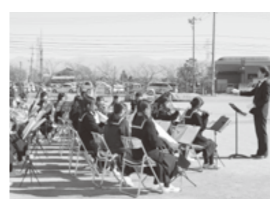
▲押原中ブラスバンド部による演奏