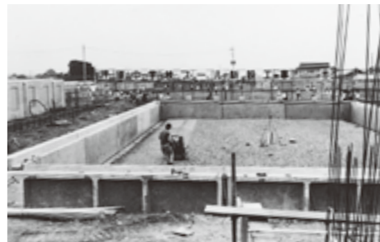
▲昭和53年、新設工事中の押原中学校プール

真冬にプールの話です。押原中学校のプールおよび更衣室は、建設から30年以上経過し水漏れや老朽が目立つことから、2年前よりプールの使用を中止していましたが、今シーズンのプールの再開に向け、昨年末より改修工事を実施しています。 主な改修箇所は、プール槽の塗替、プールサイドの張替、及び更衣室の内装改修で、プールサイドには新たに日除けを設置します。