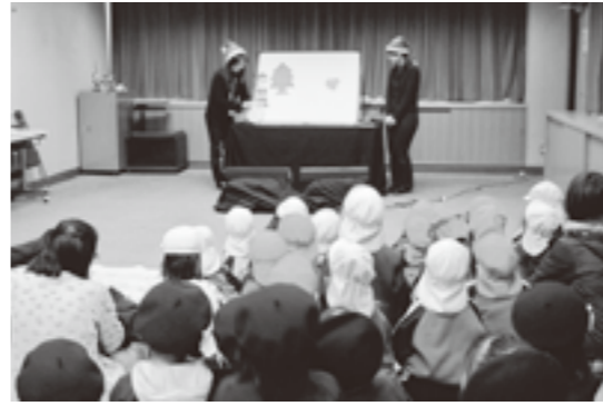
▲子どもたちも楽しんだ「クリスマスおはなし会」

町立図書館では、昨年12月16日(木)にクリスマスおはなし会を開催しました。クリスマスにちなんだおはなし、絵本、パネルシアターなど楽しいプログラムで、子どもも大人も大喜びでした。最後は、サンタクロースがやってきて、職員の手で作ったプレゼントを子どもたちに渡しました！ 参加したお母さんは、「子どもが喜んで、本当によかったです」と、目を細めてうれしそうでした。子どもたちは、おはなしに聞き入り、絵本を一生懸命見ていました。