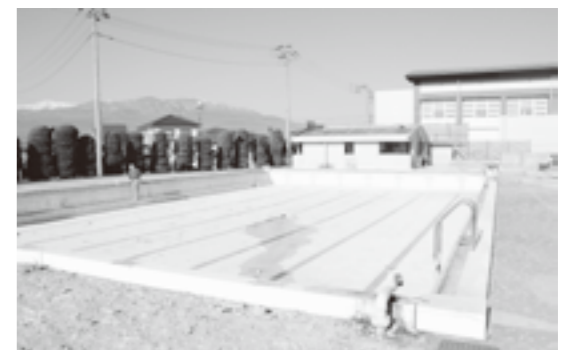
▲完成が待たれる押原中学校プール

また、改修工事に付随して、隣接している部室の塗替と整備を実施します。工事関係車両の通行や工事音で、生徒や近隣にお住まいの皆様にはご迷惑をおかけしますが、ご理解とご協力をお願いいたします。完成は、本年3月の予定です。 先日、水をはらったプールの底に降りたところ、塩素による漂白跡や剥げ落ちた槽壁の塗装に、あらためて老朽の激しさを確認するとともに、このプールの歴史を垣間見たような気がしました。 夏になれば、きれいに生まれ変わったプールに、再び歓喜の音が響きわたることでしょう。 暑い夏が待ち遠しいですね。