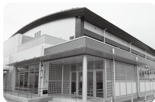
昭和町地域交流センター

フェスティバル開催中は高校生や大人の太鼓団体による模範演奏、来場者体験型の太鼓の体験コーナーや昭和町や山梨県の観