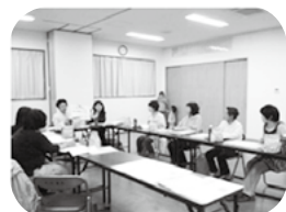
地区ごとに訪問がスムーズに行えるよう、保健師・執行部で研修を行いました。