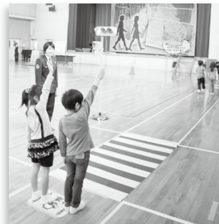
▲西条小1年生の交通安全教室