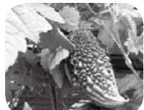
昨年のゴーヤの様子

昨年引き続き、今年も庁舎に緑のカーテンを設置しました。今年は、町民の方にも見やすい場所として、本庁舎一階出納室前にも緑のカーテンを設置しましたので、どうぞ見学してください。最新の状況は、町ホームページのブログ「山なししようわ」で確認できます。