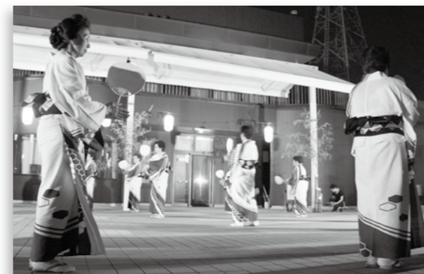
▲鎌田川の源氏ボタルを歌った「鎌田小唄(螢小唄)」にあわせた踊り(昭和町文化協会舞踊部の皆さん)

そして、昭和町源氏ホタル愛護会の25周年を迎えた今年、6月8日(金)に、「第1回昭和町ホタル夜会」が押原公園で開催されました。また、5月31日(木)には「杉浦醫院ホタル鑑賞会」が、杉浦醫院で初めて開催されました。