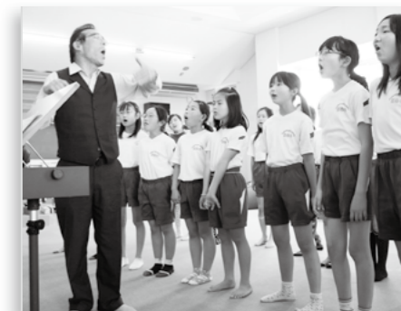
▲西条小学校児童による文部省唱歌「ほたる」の合唱(ホタル夜会で録音した歌声を披露)