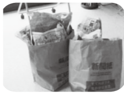
不分別のゴミの例 再生紙として捨てられていた、てんぷら油を染み込ませた新聞紙。

「困ります！」 「ゴミ出しはルールを守って」 正しくないゴミの出し方は、リサイクル等の再資源化を妨げたり、ゴミ収集に、余計な手間が発生してしまいます。「自分だけなら…」という一人のわがままが、みんなの迷惑につながります。 正しい方法で、正しい場所に、正しい時間でのゴミ出しをお願いします。