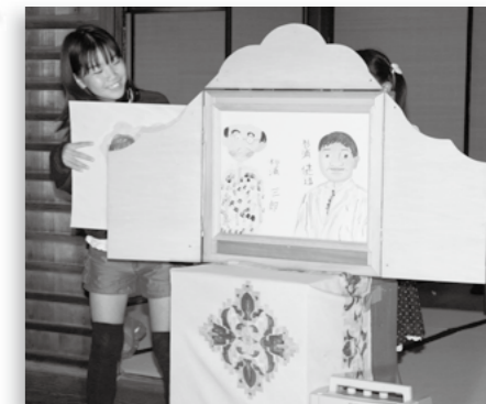
▲ホタルと地方病をテーマにした手作り紙芝居(押越子ども造形教室の児童)

来年も、一匹でも多くのホタルが飛び交い、昭和町を明るく灯してくれると良いですね。