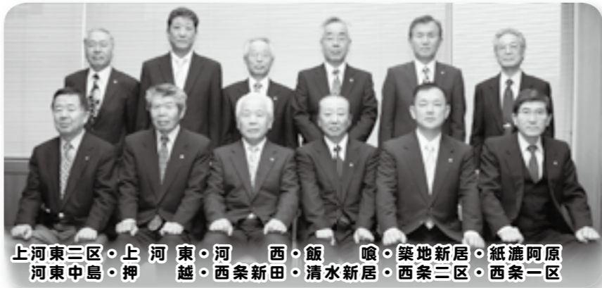
阿原一区 渡瀬二区 紙漣三区 新居四区 築地五区 喰六区 飯七区 西八区 河東九区 上十区 三島十一区 東中島十二区

町民の立場で町民の皆さんと行政をつなぐ役割を担っていただく地区役員の皆さんを、よろしくお願ひします。