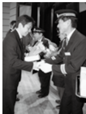
退団者の皆様、長年にわたる消防団活動お疲れ様でした