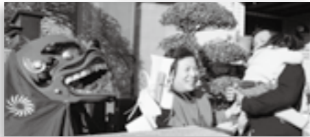
▲どんどん焼きと繭玉づくり（西条二区）