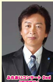
ふれあいコンサート 2nd 「新沼謙治」