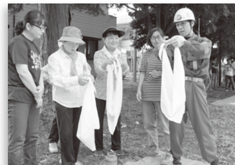
▲ 三角巾を使った応急処置訓練 (河西)