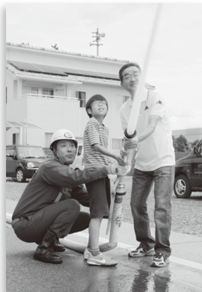
▲ 消火栓消火訓練 (飯喰)

8月31日(日)、町内各地で防災訓練を行いました。各地区の自主防災会の主催する防災訓練では、多くの皆さんが参加し、いざという時の備えを再確認していました。