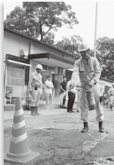
▲ 消火器消火訓練 (西条二区)