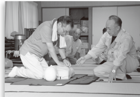
▲ AED による救急蘇生法訓練 (西条二区)