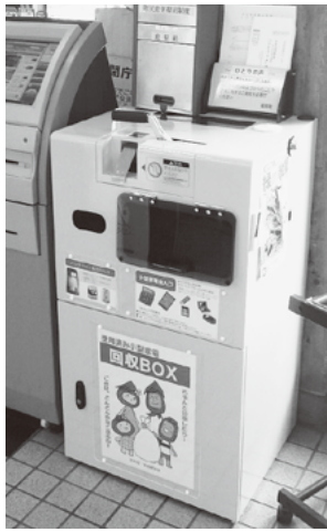
小型家電回収ボックス

※家電リサイクル法対象品の廃棄は、郵便局でリサイクル券を購入し、指定引取場所へ持ち込んでください。詳しくはお問い合わせください。