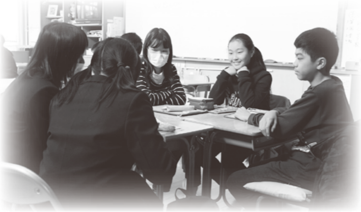
甲府昭和高校と小学生の合同英語授業

また、「風土伝承館 杉浦醫院」を活用し、地方病の歴史を学ぶ郷土教育、生涯学習を推進します。本町の象徴である源氏蛍の保護・復活活動も、源氏ホテル愛護会の活動支援を継続するとともに、5回目となるホテル夜会を開催し活動推進とPRを図ります。