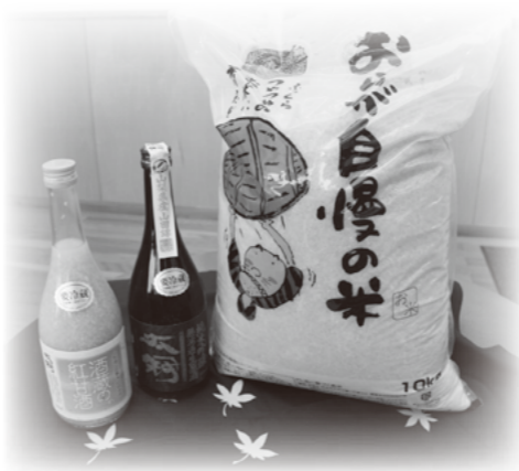
ふるさと納税お礼の品

このような意味で、「男女共同参画推進委員会」や「人と環境すつきりしようわ」、「国際交流を進める会」など、町内で活躍する各種団体との連携・支援は重要です。また、商工会の皆様と連携を図り、交流人口の増加による波及効果とともに享受できるよう進めていきます。その一環として、ふるさと納税の拡充についても、商工会や「いーなとうぶ」のご協力をいただき、平成27年度は、前年度比約30倍の実績が見込まれています。今後も頑張る地方の姿を積極的にアピールし、昭和町を応援していただける方への感謝を伝えるとともに、交流人口や、定住人口の増加につなげ財政への寄与を図っていききたいと思います。