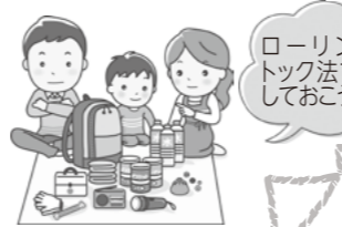
ローリングストック法で備蓄しておこう！

缶詰・カップラーメン・レトルト食品・トイレトペーパー・ティッシュペーパー・ビニール袋・ラップ・乾電池・ペットの餌など