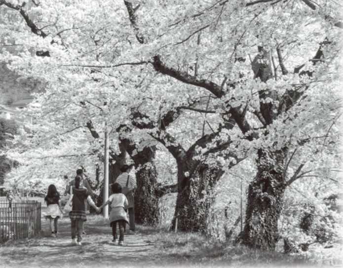
▲ソメイヨシノをはじめとする桜の巨木が約80本植えられています！