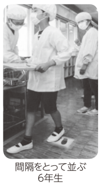
配膳前の消毒をする6年生

右の写真は、時間差をつけて距離を保ち、整然と配膳する六年生です。さすがに最上級生です。