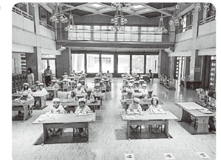
みんなで同じ方向を向いてゆったり食べる2・3年生