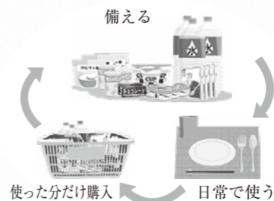
ローリングストック法のイメージ

一週間の食料を備蓄するというと、ちょっと難しいイメージがあるのではないのでしょうか。確かに、非常食を一週間分用意すると費用や備蓄のスペースの面でも難しそうです。例えば、各ご家庭で冷蔵庫の中にご飯や食パン、冷凍食品等が入っていれば、最初の3日間くらいをこれらで済ませます。次の3日間は非常食を含め、ローリングストックをしている食材を活用して賄います。そのほかインスタントヌードルや、チョコレートなどの菓子類を組み合わせて、工夫をすることで一週間分を備えることができるかと思えます。