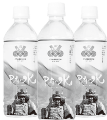
ボトルドウォーター「甲府の水」

ボトルドウォーター「甲府の水」が国際的な品質評価機関であるモンドセレクションの2020年「ビール、飲料水&ソフトドリンク部門」で優秀品質「最高金賞」を受賞しました。