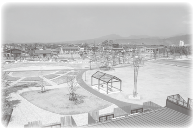
押原公園「ゆめパーク昭和」

本町の財政は、税制改正における法 人町民税の減収と社会保障費などの扶 助費や教育、福祉予算の増大等により、 依然として厳しい状況が続いておりま す。そのようななか、住みよいまちづ くりのための道路整備計画や公共施設、