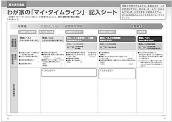
わが家の『マイ・タイムライン』