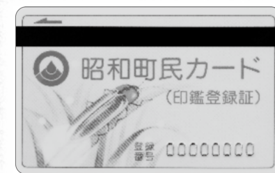
▲ 昭和町民カード（印鑑登録証）

今後は、令和3年2月から開始しておりますマイナンバーカード（個人番号カード）によるコンビニ交付又は役場内のキオスク端末をご利用ください。