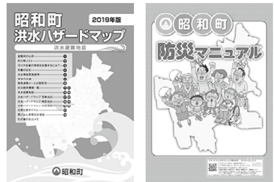
『昭和町洪水ハザードマップ』と『昭和町防災マニュアル』