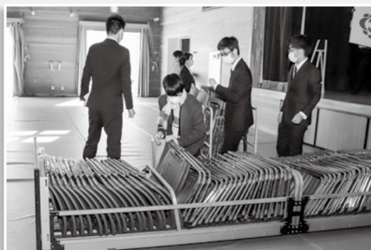
▲ 閉式後、新成人の皆さんも会場の 片付けに協力してくれました！