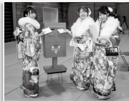
▲ 10年後の自分へ宛てた 手紙を入れるポストが 設置してありました