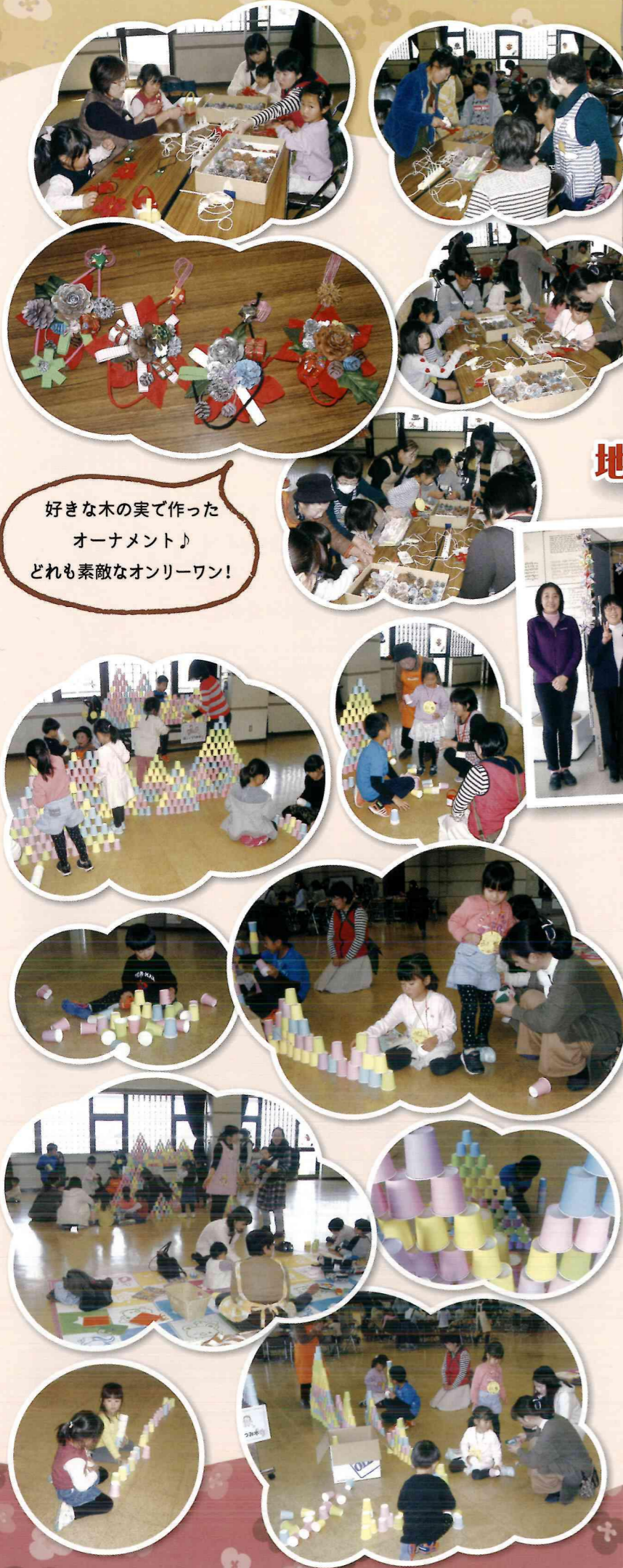
好きな木の実に作った オーナメント♪ どれも素敵なオンリーワン!

参加申し込み・お問い合わせは ファミサポまで! (Tel.055-275-8115)