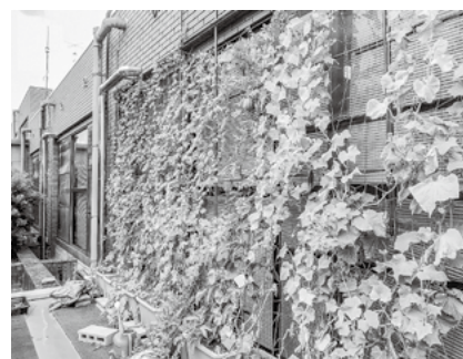
昨年7月の緑のカーテン

昭和町立図書館 〒409-3864 昭和町押越 575 ☎ 275-7860 FAX 275-7870 URL https://www.lib.showacho.ed.jp/