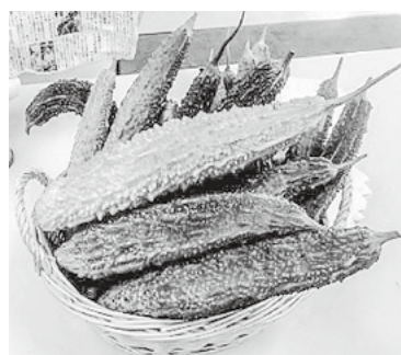
去年収穫した「役場野菜」

※収穫の有無については、お問い合わせください。 ※今年は収穫が少し遅くなる可能性があります。