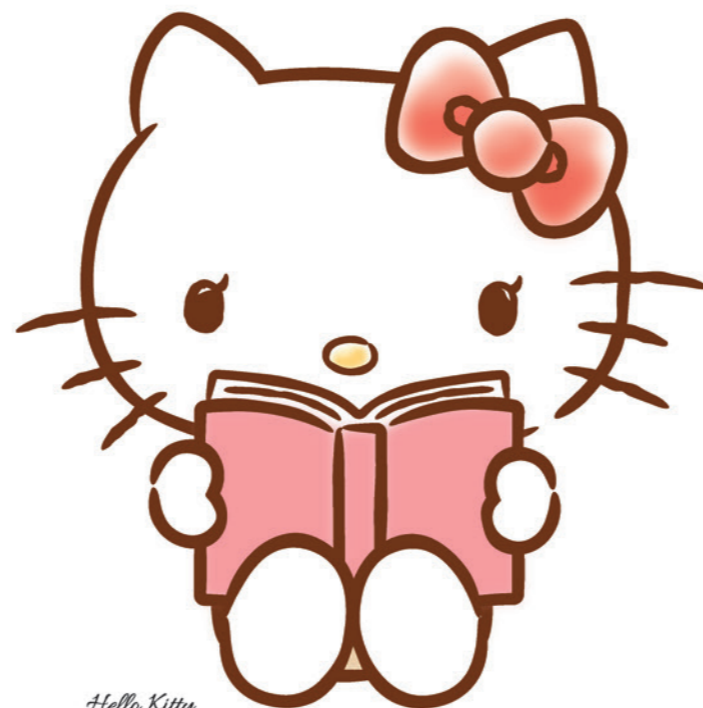
Hello Kitty ©2022 SANRIO CO., LTD. APPROVAL No. L632813

ファミリーサポートで援助することができるのは突発的・短期間・短時間の保育です。何か困った事があったらご相談ください。お子さんにとって一番良い方法を、一緒に考えていきましょう。初めてサポートする際には事前打合せを行い、お子さんが安心して過ごせるように配慮しています。