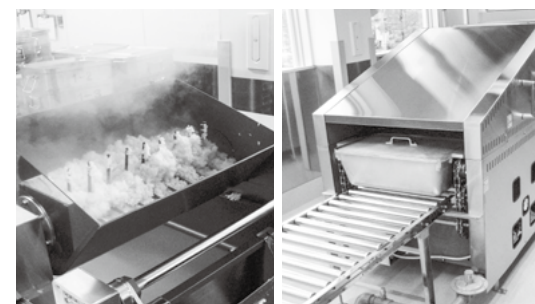
ほぐし機 連続炊飯器

給食が皆さんに届くまで⑧ 次々に炊き上がります！ 毎日2千食以上の給食を調理する給食センターでは、一度に、100キロ以上の米を炊いています。その為、連続炊飯器という機械が活躍します。コンベア型の