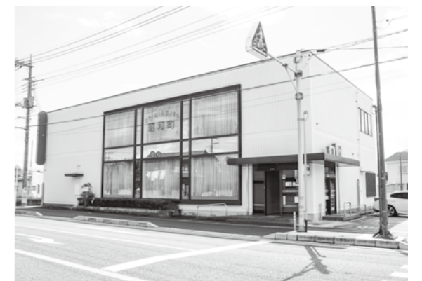
(旧) 山梨中央銀行昭和支店

施設整備までの間、子どもの居場所として町が助成をしている町内こども園(3箇所)の子育て支援センターや児童館(西条・押原・常永・児童センター)、相談ごとがある場合は、令和6年4月1日開設予定の「こども家庭センター」の準備室(いきいき健康課内)もお気軽にご利用ください。