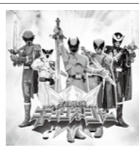
王様戦隊キングオージャー ショー (1回目) 11:20 ~ (2回目) 15:20 ~ 《ショーとサイン会》 場所: メインステージ