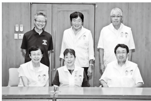
昭和町人権擁護委員

特設相談所の日程などは、広報しょうわでお知らせしていますので、皆さんお気軽にご利用ください。