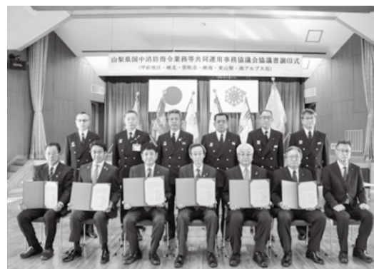
協議書調印式の様子

運用開始後の管轄区域は、甲府市・甲斐市・中央市・北杜市・韮崎市・山梨市・甲州市・笛吹市・南アルプス市の9市と、昭和町・市川三郷町・富士川町・早川町・身延町・南部町の6町で、管轄人口は約63万人となります。